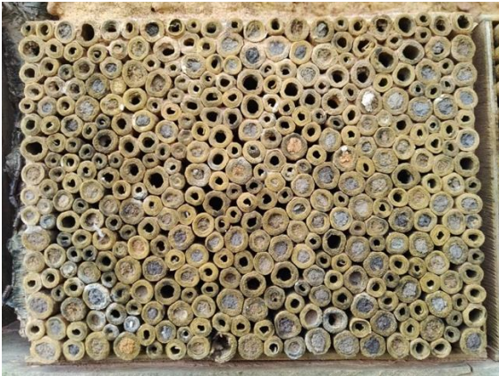
Belegte Pappröhren

Die Angebote in unseren Insektenhotels werden bisher gut angenommen, wie auf dem Foto zu sehen ist. Viele "Wohnungen" in den Pappröhren sind belegt, aber auch andere Brutröhren werden gut angenommen. Dazu können die Insekten nun auch in ein Eichen-Haus oder ein Ahorn-Haus einziehen. In den getrockneten und möglichst rissfreien Stücken sind viele unterschiedlich große Bohrungen als Brutröhren.