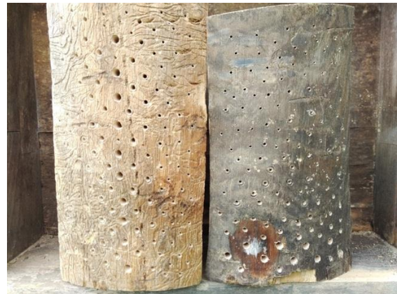
Eichen- und Ahorn-Haus